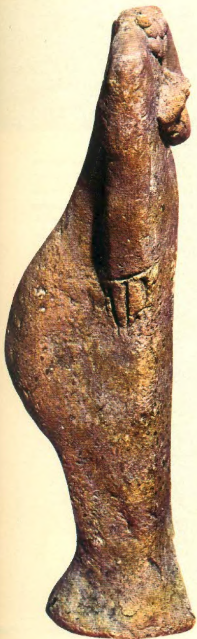
Idolo femenino mesopotámico anterior a la diferenciación de las divinidades femeninas, con el desarrollo adiposo característico de las esculturas primitivas (Museo del Louvre, París).

Pero, a pesar del riguroso método científico adoptado en estos últimos años, no ha sido posible encontrar todavía en Mesopotamia restos antropológicos de las primeras industrias paleolíticas. Hay que recordar que con sus periódicas crecidas los ríos han cubierto la llanura de una espesa capa de aluvión que impediría reconocer el paso del hombre si no fuera por las plataformas arti-